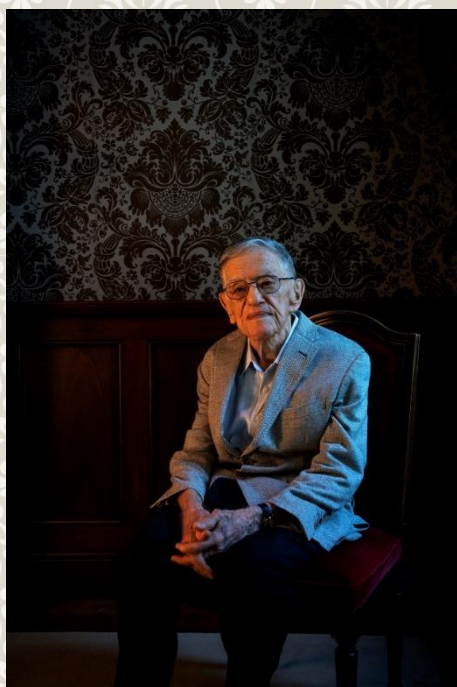
ドナルド・キーン